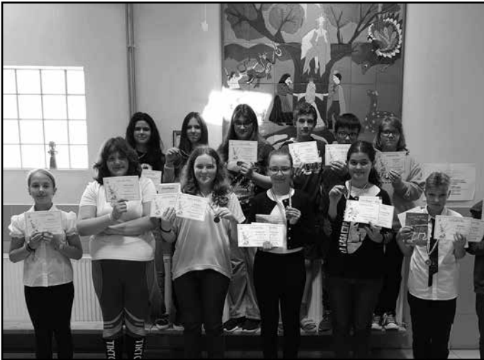
A Tudásbajnokság érmesei