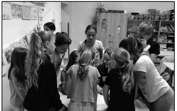
Csapatverseny a gyereknapi

Május 24-én rendeztük meg iskolánkban a gyereknapi. Reggel Margó néni köszöntője után a tanulók csapatokba rendeződtek, majd megindultak a különböző állomásokra. Érdekes feladatok vártak a csapatokra: tájékozódó futás, digitális board, darts, totó, célbadobás, lövészet, öltözz-vetkőzz, puzzle, tárgyfelismerés stb. Az ácseszéri konyha jóvoltá-