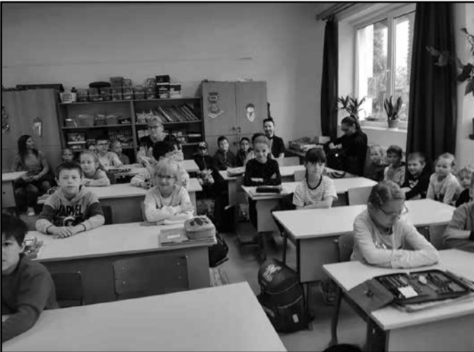
Az ovisok látogatása