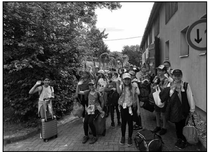
A 4. osztály Bakonybélben