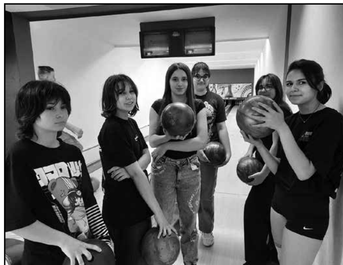
Pillanatkép a 8. osztályos kirándulásról