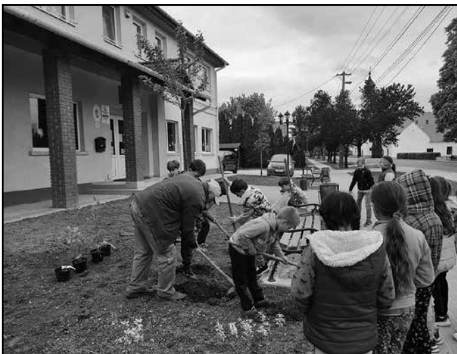
Munkában az iskola előtt