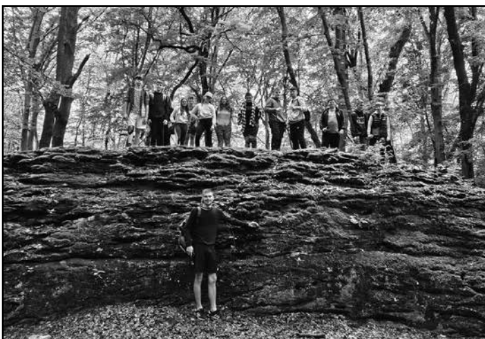
Kirándult a 7. osztály

A hetedik osztály diákjai Bakonyszentlászlón és Vinyén jártak erdei iskolában. A két nap alatt sok eseményen vettünk részt. Túráltunk délelőtt, délután szalonnát sü- töttünk, bújócskáztunk illetve ipiapacsoztunk. A vacso- ra után pedig éjszakai „bátorságpróbára” indultunk a