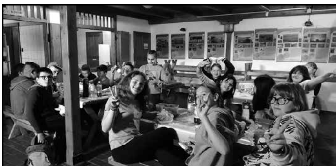
A 6. osztály erdei iskolában