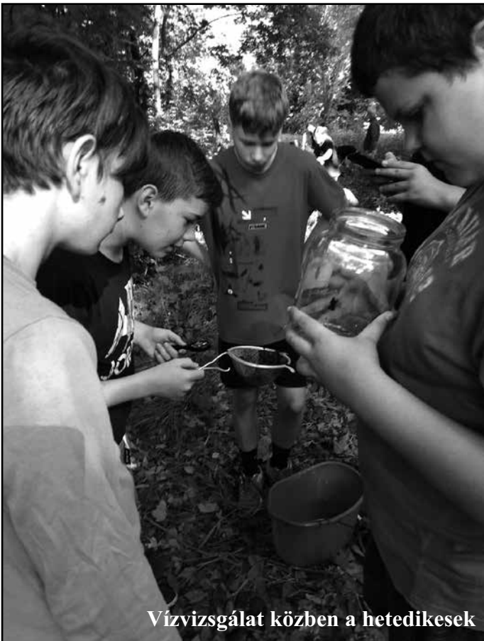
Vízvizsgálat közben a hetedikesek

A mintavétel során a diákok kézi hálóval és az iszap átmosásával vízi gerincteleneket kerestek. A talált fa-