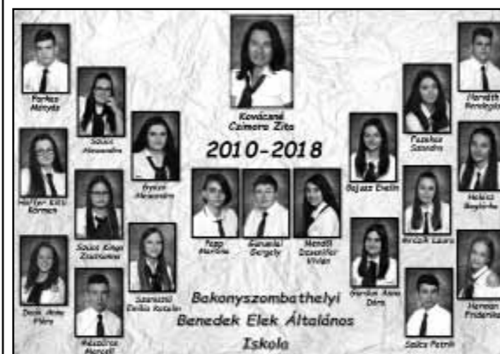
8. osztály tabló

A sokat sportoló felnőttek esetében ugyanakkor a telomerek hét évvel kevesebb öregedést sejtetnek, mint kevésbé aktív kortársaik esetében, az inaktív felnőtteknél pedig kilenc évvel tűnnek ez alapján fiatalabbnak.