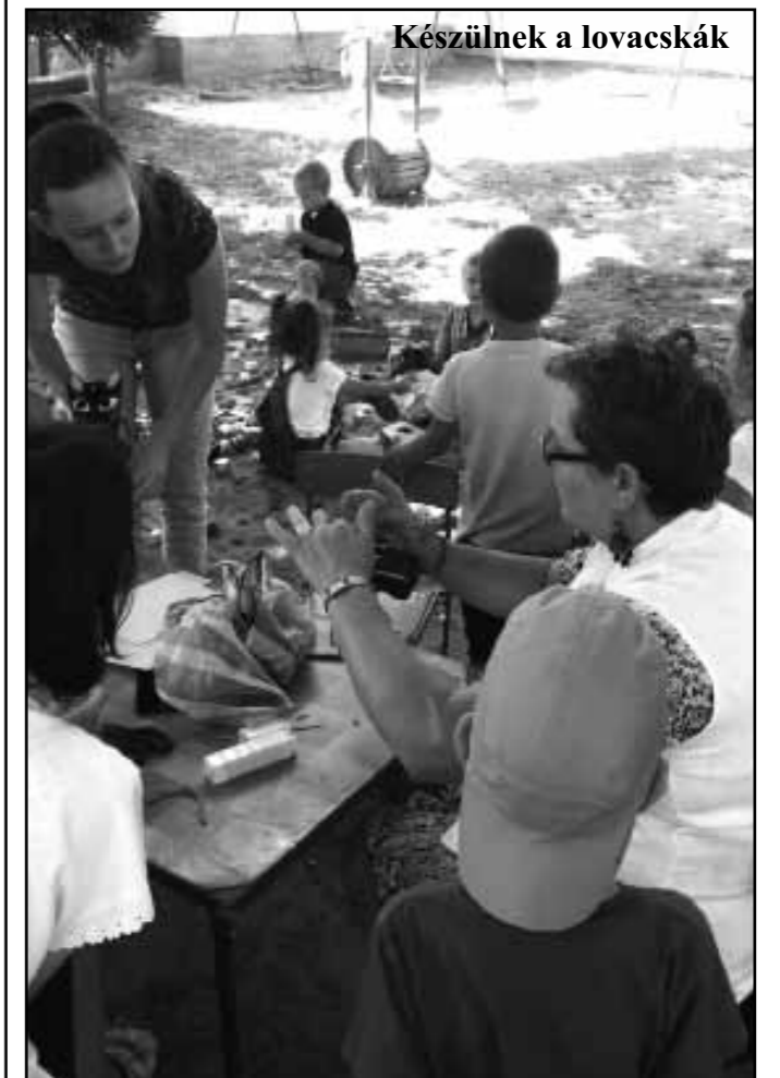
Készülnek a lovacskák