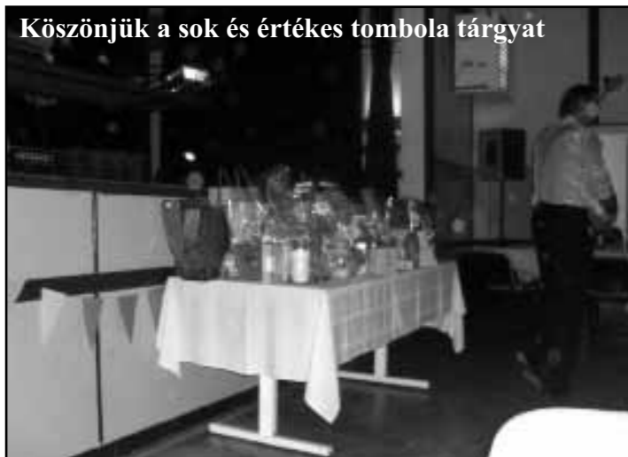
Köszönjük a sok és értékes tombola tárgyat

talra, ahol a tombola tárgyak kínálták magukat megnyerésre. Az előtérben berendezett fotó-falnál mindig használatban voltak a mókás eszközök, megörökítve a bál vidám pillanatait.