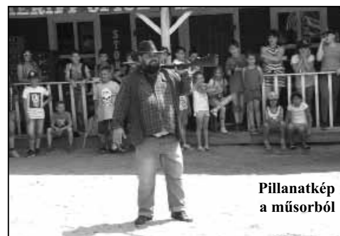
Pillanatkép a műsorból

Ebéd után következett az egyórás western show. Eb-