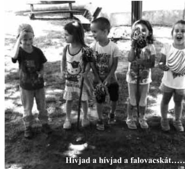
Hívjad a hívjad a falovacskát.....

sa szerint nagyon jól érezte magát, kicsit elfáradt a napi tevékenységek végzése közben, de minden reggel szívesen jött. Két hét alatt sok új játékkal ismertette meg a gyermekeket, mely a képző intézmény által előírt feladata (is) volt. A 2017-18-as nevelési évben ő már a negyedik hallgató volt, aki a mi óvodánkat választotta gyakorlati helyül. Tapasztalatairól hospitálási naplóban kell számot adnia. A gyakorlatvezetőknek többletmunkát ad, de szívesen vállaljuk, mert ez is egyfajta szakmai elismerés a végzett munkánkról.