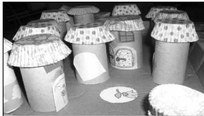
Apraja falva, termékek újra hasznosítása

Megújítottuk a fűszerkertet is begyűjtöttük a növényeket. Citromfűből és mentából frissítő teát készítettünk. A gyerekek óvatosan kóstolgatták az ízesítés nélküli italokat, ismerkedtek az illatok után az ízekkel. A növényeket csokorba kötve szárítjuk. A borsó és hagyma helyére paradicsom palántát ültettünk bízva abban, hogy termését az őszi köszöntő napon megkóstolhatjuk majd.