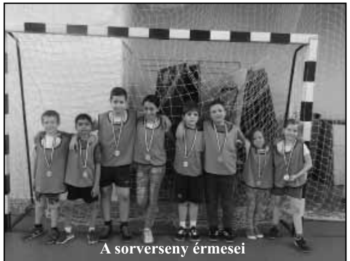
A sorverseny érmesei

Február 27-én alsó tagozatos tanulók játékos sorversenyen mérhették össze ügyességüket, gyorsaságukat. Az osztályok 8 kiválasztott tanulót küldhettek a versenyre, ahol 4 csapatban versenyezhetek egymással. Az első három helyezett csapat tagjai érmet kaptak.