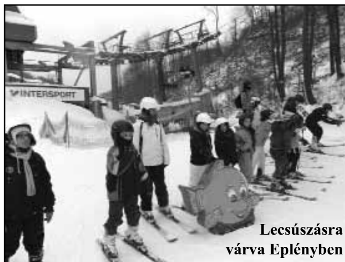
Lecsúszásra várva Eplényben