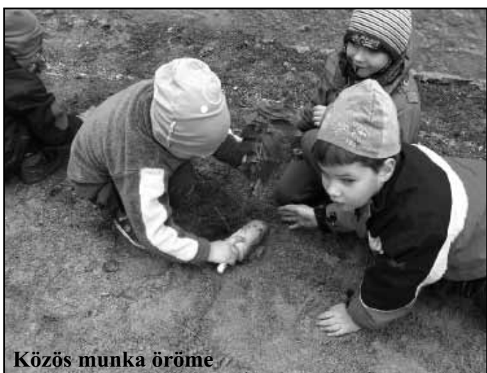
Közös munka öröme