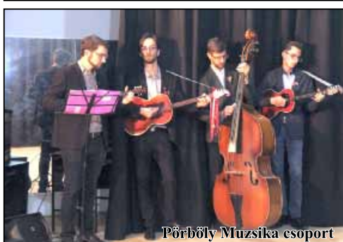
Pörböly Muzsika csoport