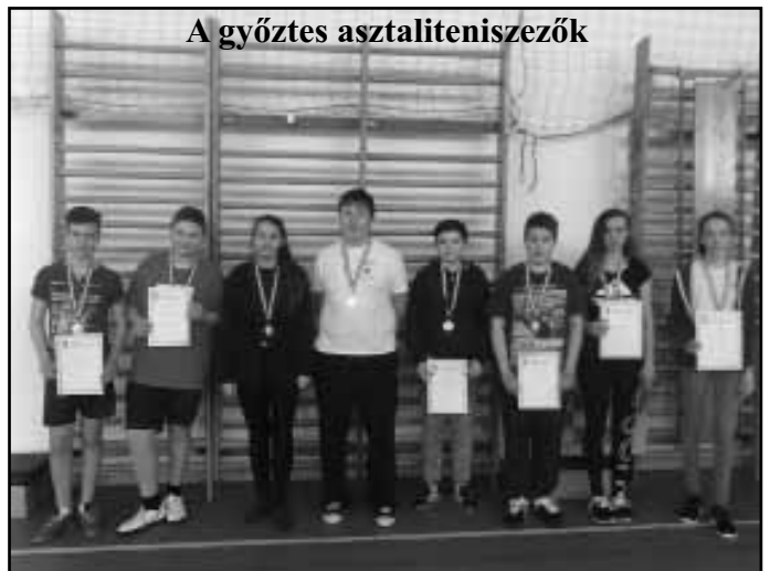
A győztes asztaliteniszezők