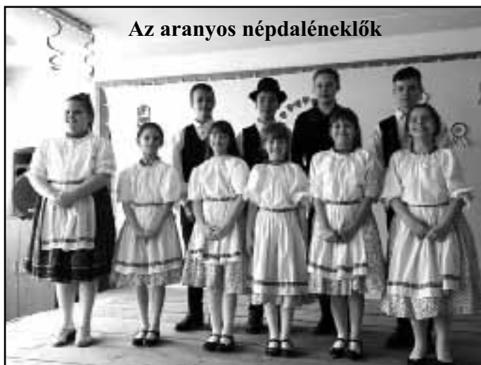
Az aranyos népdaléneklők