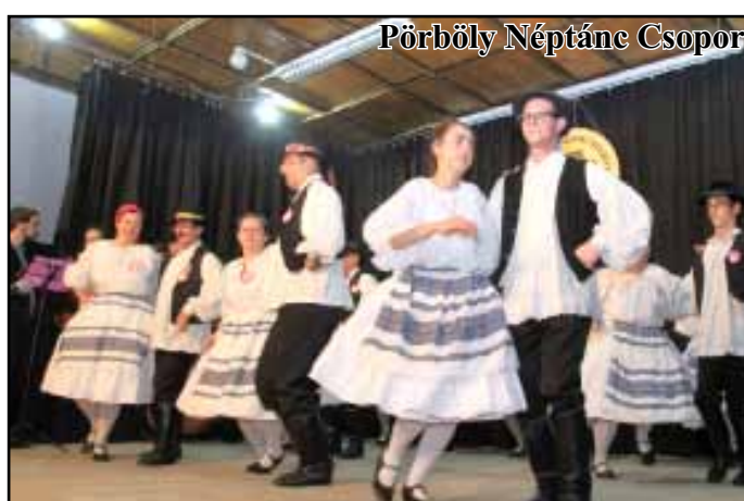
Pörböly Néptánc Csoport