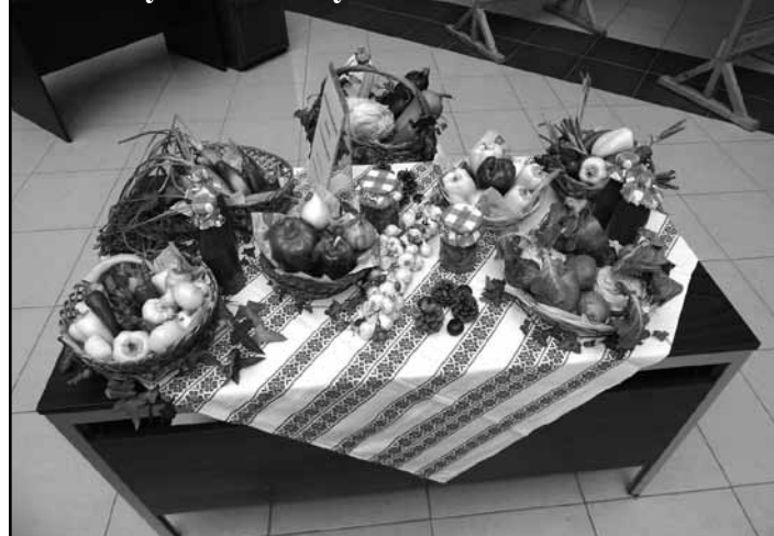
A bakonyszombathelyi kiállítás másik oldalról