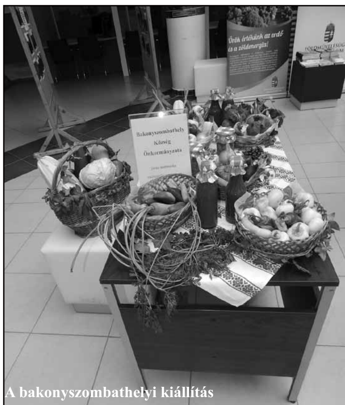
A bakonyszombathelyi kiállítás