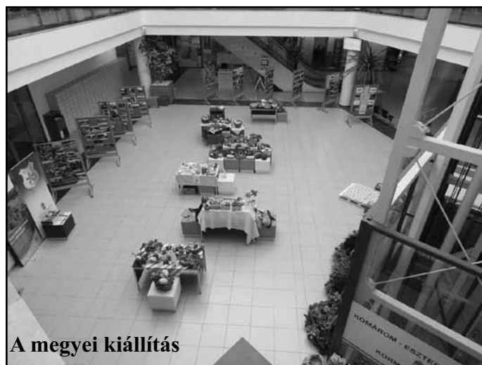
A megyei kiállítás