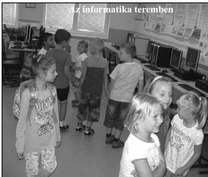
Az informatika teremben