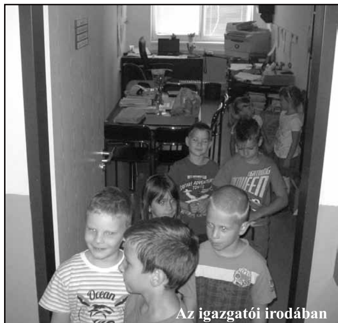
Az igazgatói irodában