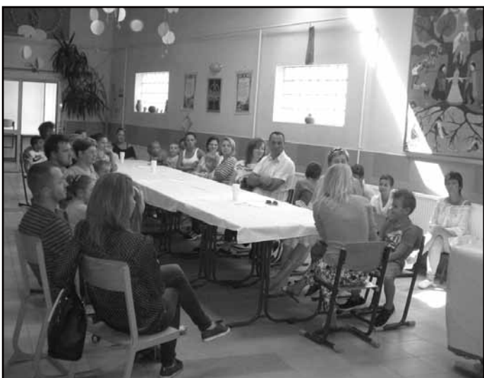
Az elsősök és szüleik az aulában