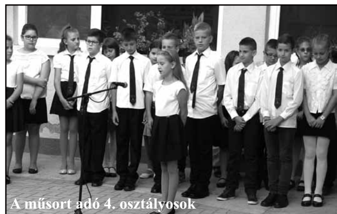
A műsort adó 4. osztályosok